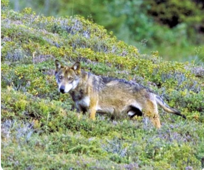
Le loup de la région grisonne de la Surselva: il s'agit d'un mâle qui a un territoire bien défini.