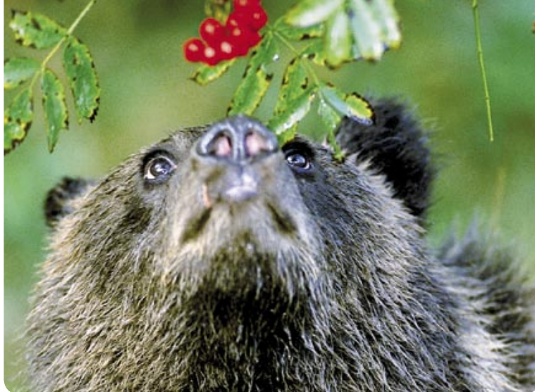
L'ours est principalement végétarien: il mange, surtout en automne, des très grandes quantités de fruits et de noix.