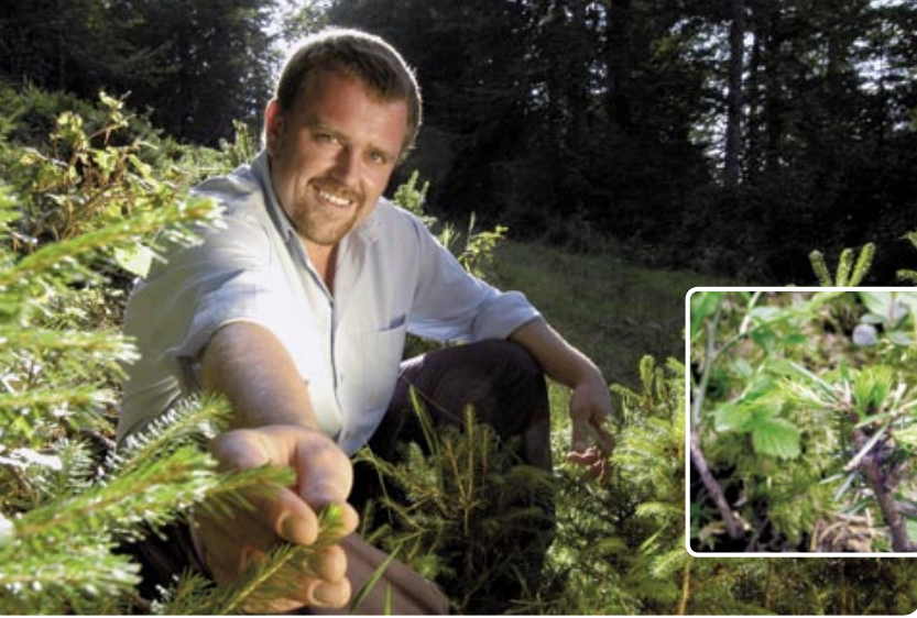
Protection des jeunes peuplements: les dégâts de broutage diminuent là où les grands prédateurs apparaissent.