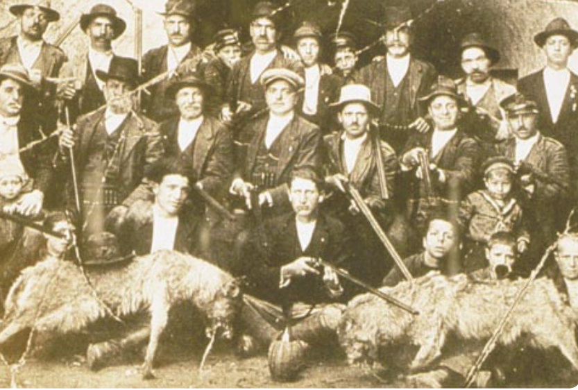
Le loup, figure de l'ennemi: l'apparition des armes menace l'existence des grands prédateurs dans l'espace alpin.