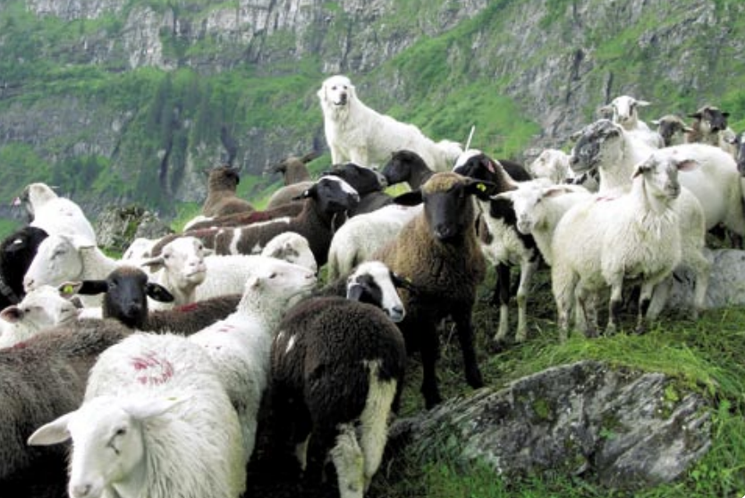
La protection des troupeaux: une tradition oubliée à réapprendre au profit de la nature.