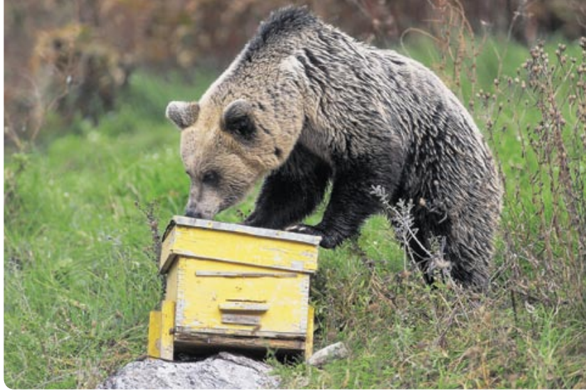
La peur de l'apiculteur: là où les ours surgissent, il convient de protéger rapidement les ruches.