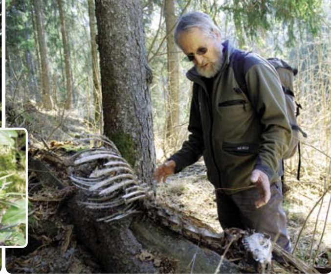
Une «police sanitaire naturelle»: les grands prédateurs tuent surtout des animaux âgés, malades et jeunes.