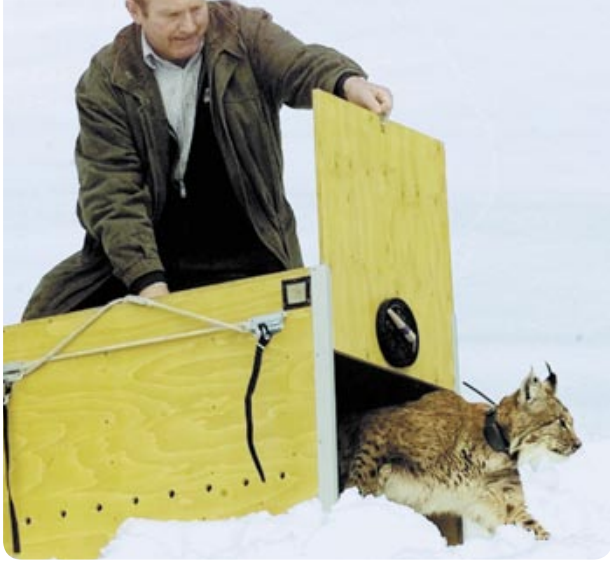
Déplacement de lynx: sans intervention humaine, l'expansion du lynx reste difficile.