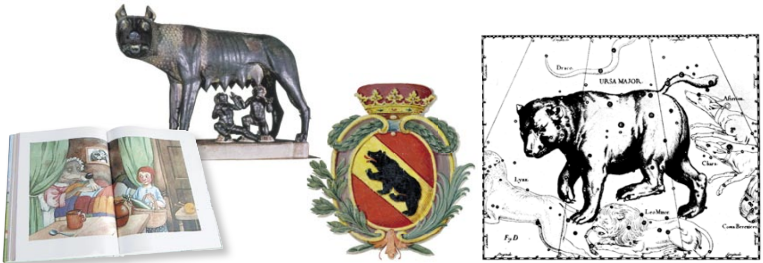
L'image des grands prédateurs dans les contes et les mythes: ni le méchant loup du Petit chaperon rouge ni le bon loup de la pleine lune ne correspondent à la réalité.