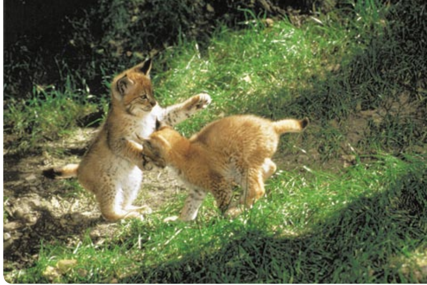
Moments de jeux des jeunes lynx: des temps difficiles pour la mère qui est seule responsable de l'élevage des petits.