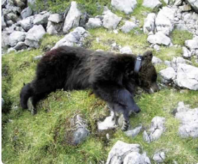
Les ours curieux peuvent poser problème. En 2007, l'ours JJ3 a été équipé d'un émetteur afin d'être surveillé.