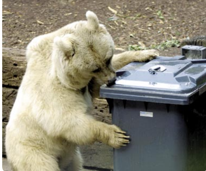
Ce que l'homme mange, l'ours le mange aussi: la gestion des déchets doit donc être adaptée en conséquence.*