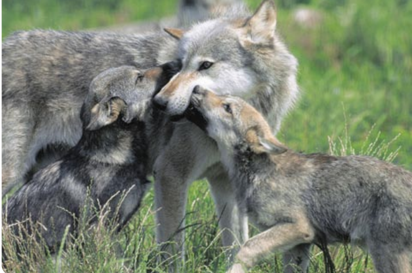
La louve et ses louveteaux: en Europe centrale, les meutes de loup sont petites. On parle de clans familiaux.