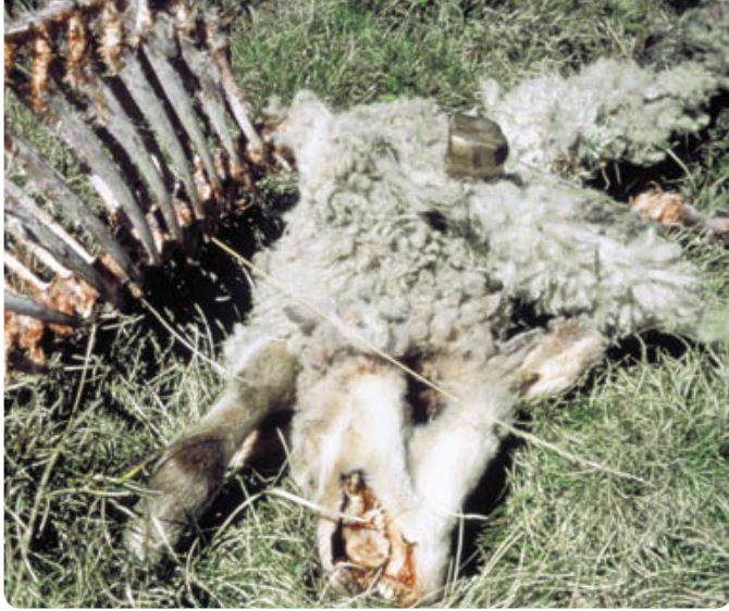
La souffrance des éleveurs de moutons: des bêtes non surveillées sont une aubaine pour le lynx, le loup ou l'ours.