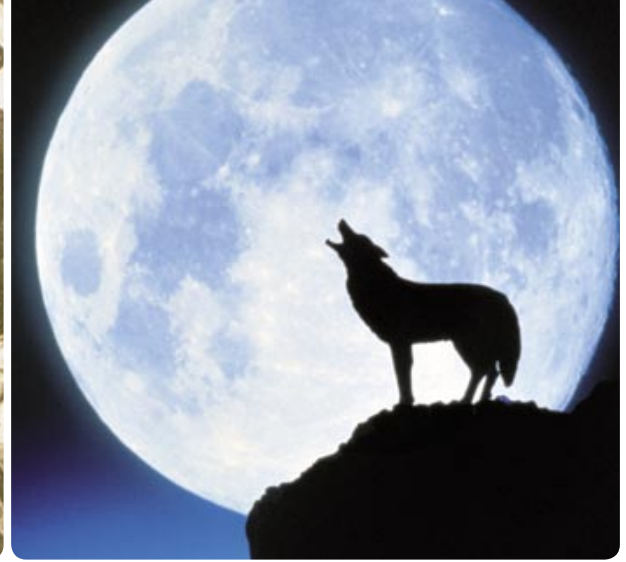
Le loup porteur d'espoir: de nos jours, le loup est souvent mythifié et perçu comme le symbole d'une nature intacte.