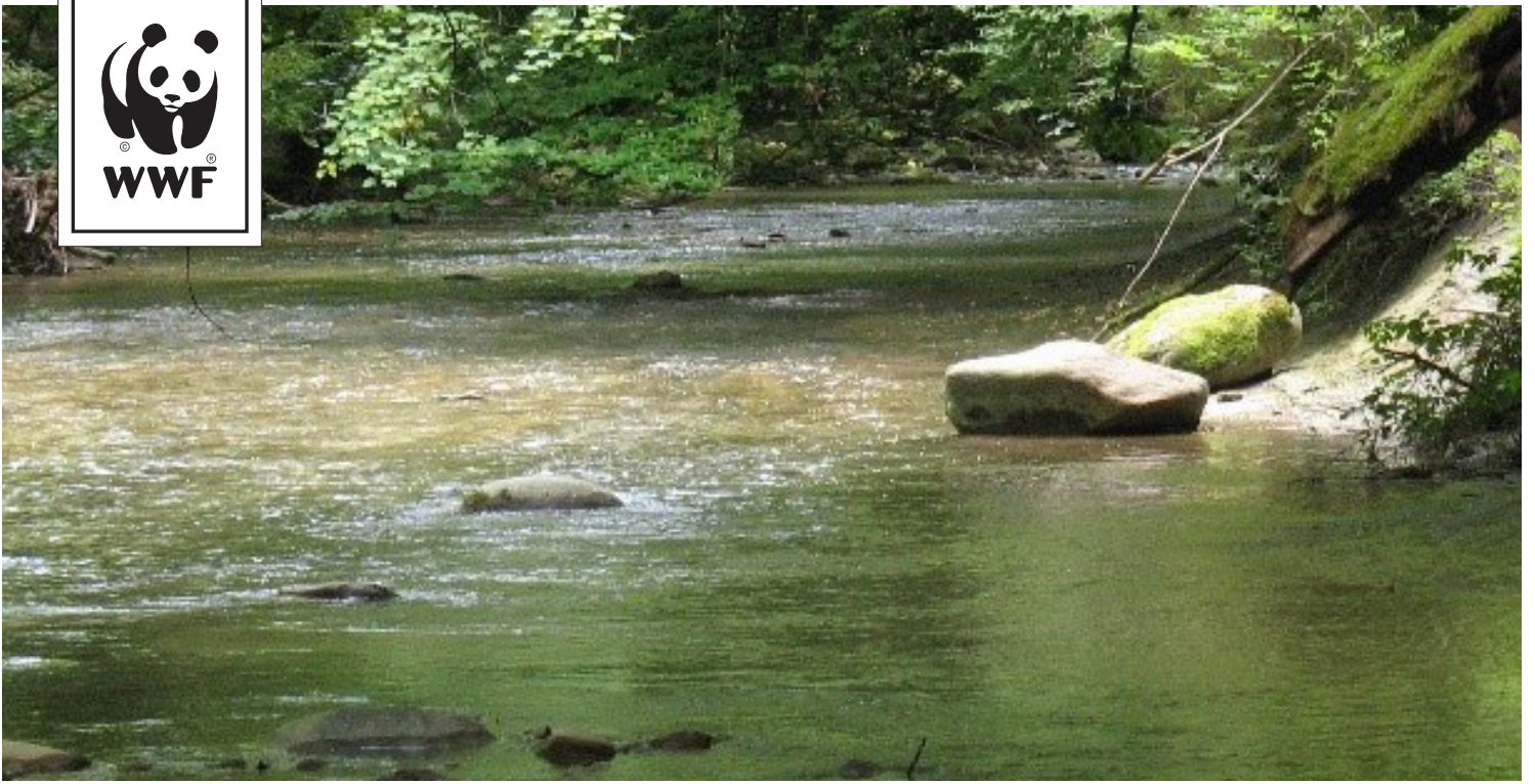
La Mentue