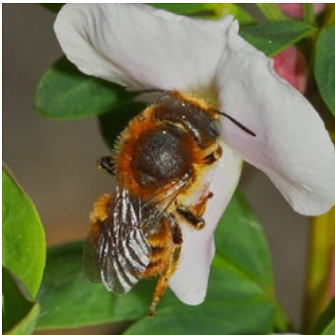
Les nichoirs permettent de préserver l'abeille des murs