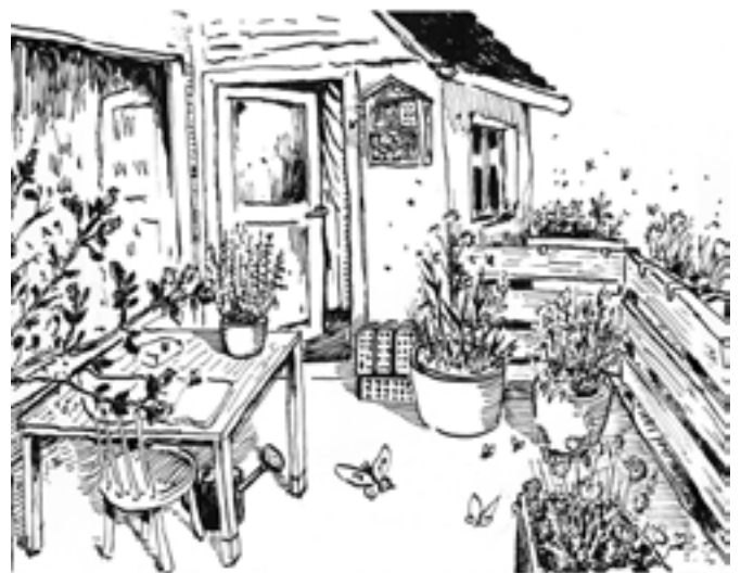
Les balcons offrent d'excellentes possibilités de favoriser la biodiversité (Illustration: Martin Chramosta)