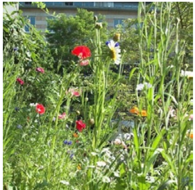
Les plantes sauvages sont une source de nourriture importante pour les abeilles sauvages

WWF Suisse / Guide d'action Particuliers