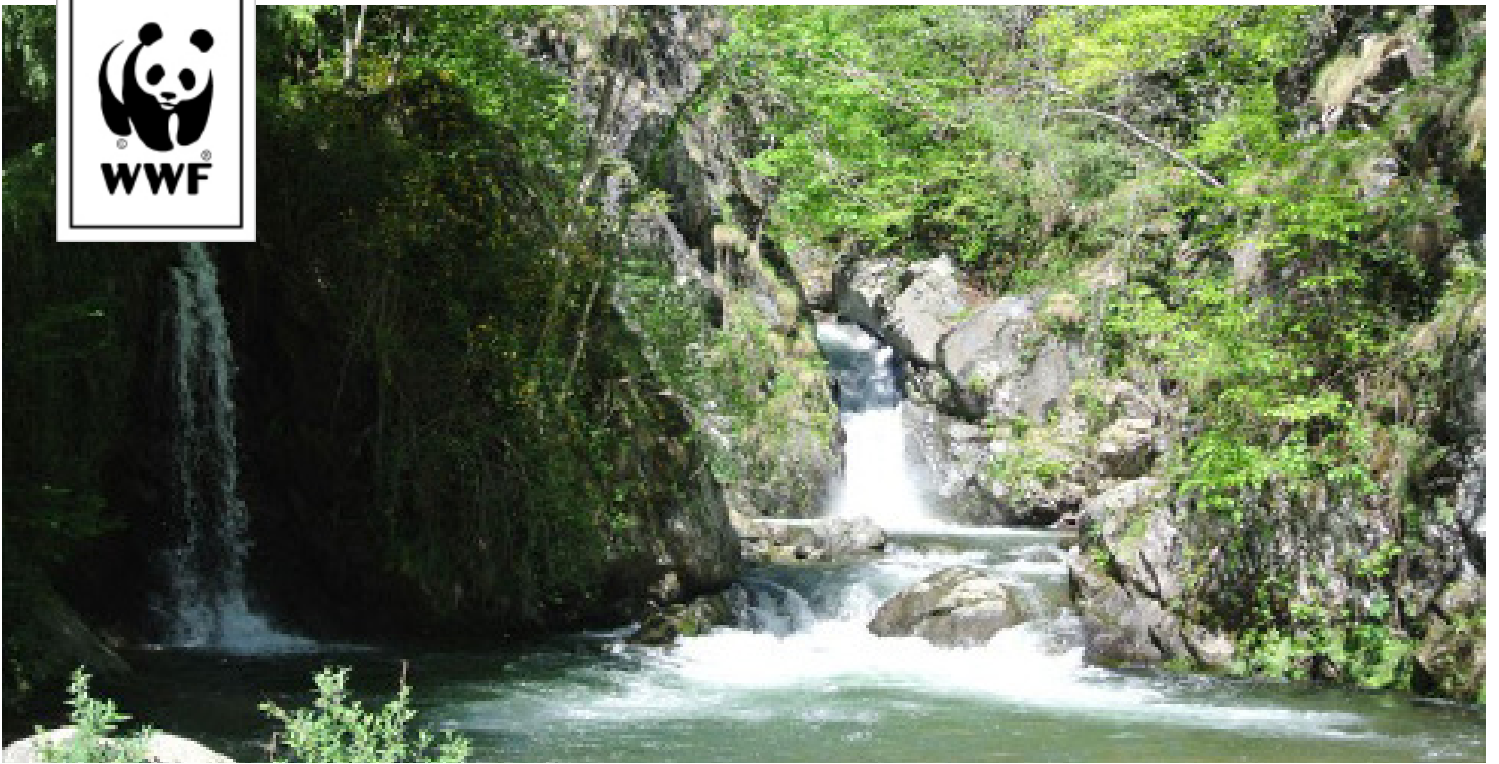
Fiume Magliasina