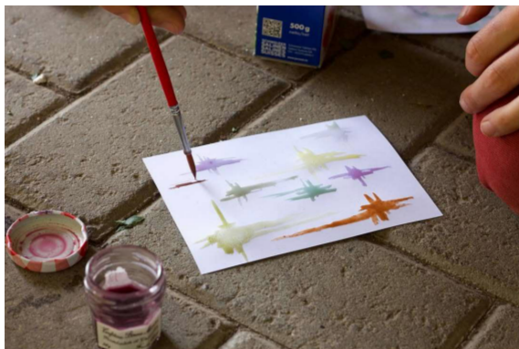
Felix Dietrich / WWF Suisse

terre : eau : colle = 10 : 10 : 1. Bien mélanger ! Pour les baies, les feuilles et le bois, c'est mieux d'essayer d'abord avec moins d'eau et de chercher lentement la bonne proportion.