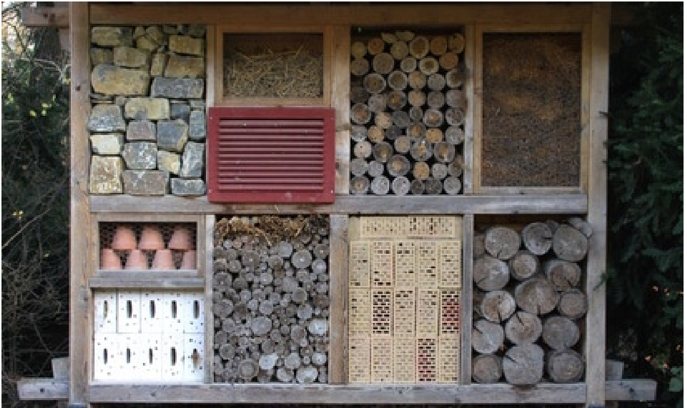
Wildbienen-Nisthilfen für verschiedene Wildbienenarten.

Holzklötze, Bohrer und vieles mehr liegen im Werkraum der Primarklasse 6a bereit. Die Schülerinnen und Schüler bauen heute Nisthilfen für einheimische Wildbienen zum mit nach Hause nehmen. Mit dem Thema machte sich die Klasse schon im Naturkundeunterricht vertraut. So wissen die Kinder, dass sie mit dem Bau von Nistkästen nicht nur die seltener werdenden Wildbienen fördern, sondern auch das Fortbestehen bestimmter Wildpflanzenarten sichern.