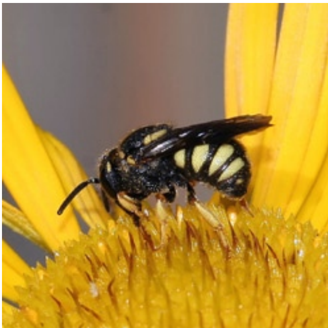
Düsterbienen lassen sich durch Aufstellen von Nisthilfen gezielt fördern.

Basteln Sie im Werkunterricht Nisthilfen, die Ihre Schülerinnen und Schüler zu Hause auf dem Balkon, im Garten oder auf dem Schulhausgelände installieren.