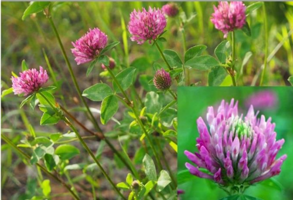
Trèfle des prés