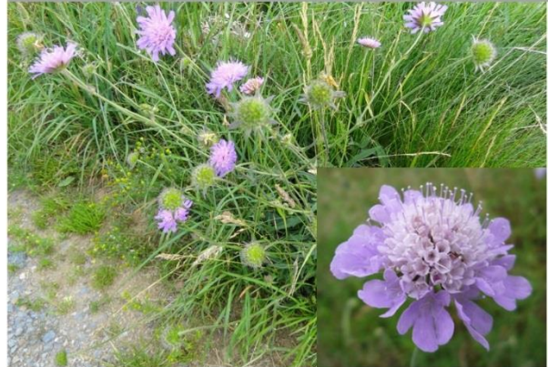
Scabieuse des champs