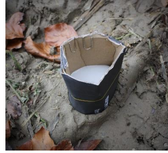
Variante mit Kartonstreifen