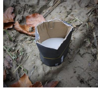
Variante avec le carton