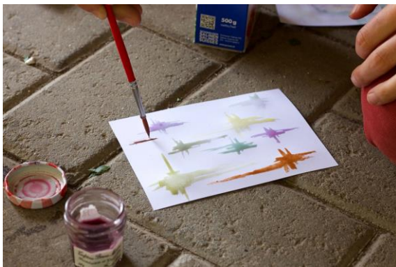
Felix Dietrich / WWF Schweiz

Erde : Wasser : Kleister = 10 : 10 : 1. Gut umrühren! Bei Beeren, Blättern und Holz besser mit weniger Wasser probieren und langsam das richtige Mischungsverhältnis finden.