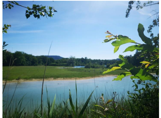
Tourbière de Rothenthurm ( carte ): une zone alluviale et divers bas-marais et hauts-marais d'importance nationale