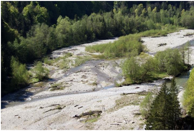
Val Verzasca ( carte ): une zone alluviale et des prairies sèches d'importance nationale